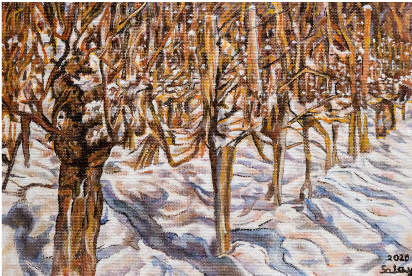
Jaroslav Salay ■ Vinohrad v zime, akryl

REALIZOVANÉ S FINANČNOU PODPOROU MINISTERSTVA KULTÚRY SLOVENSKEJ REPUBLIKY