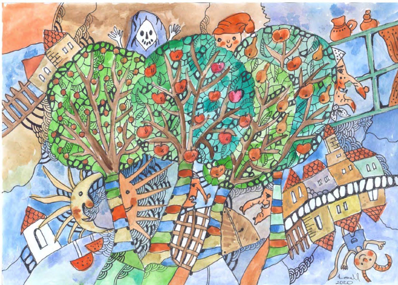
Jarmila Horváthová ■ Rozprávka, akvarel, perokresba