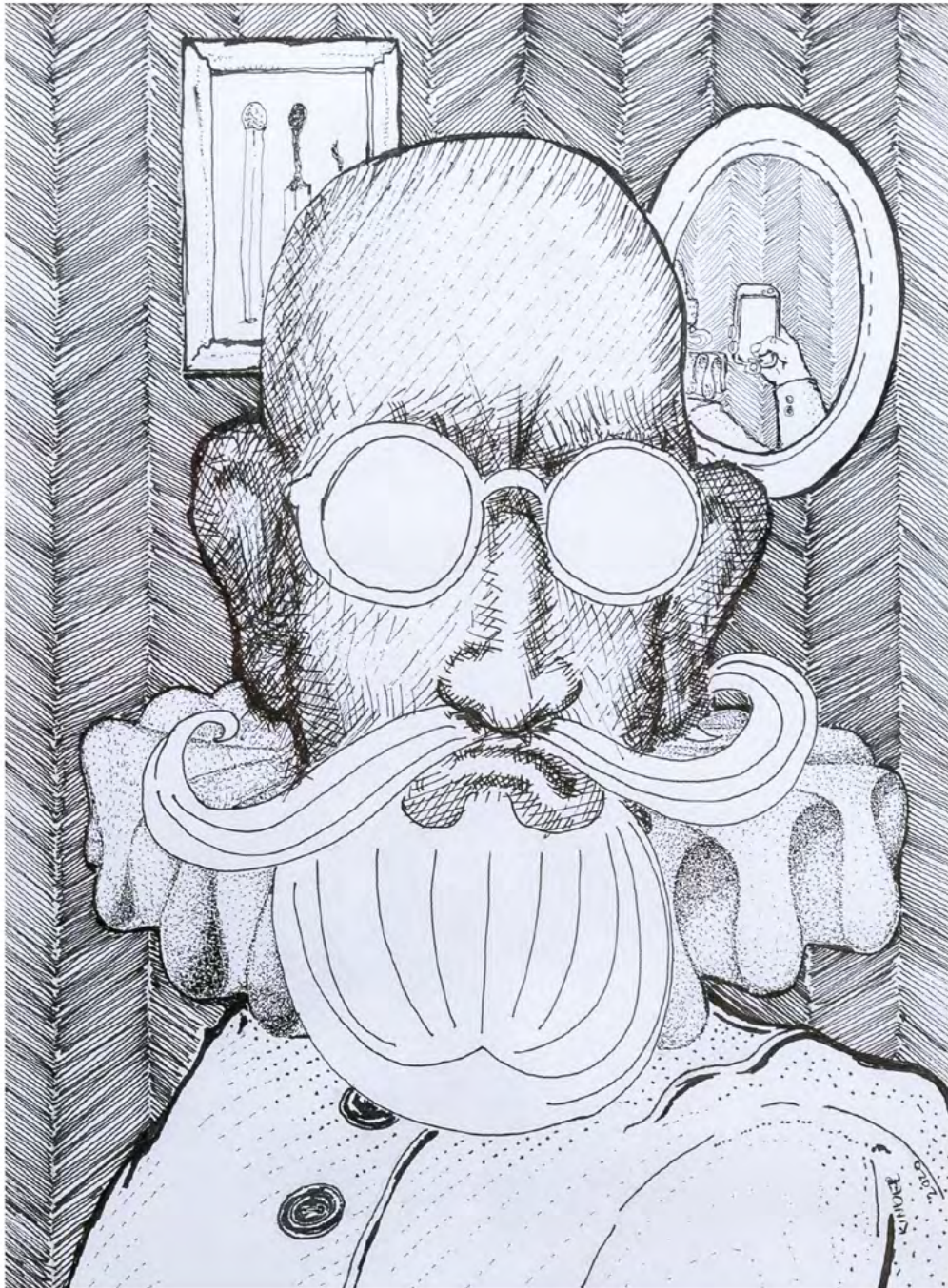
Michal Kinder ■ Selfie, tuš