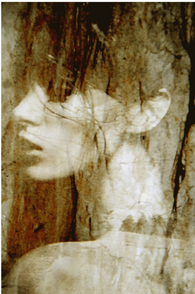
Ľubomír Jarábek - Čarovný sen I., III.