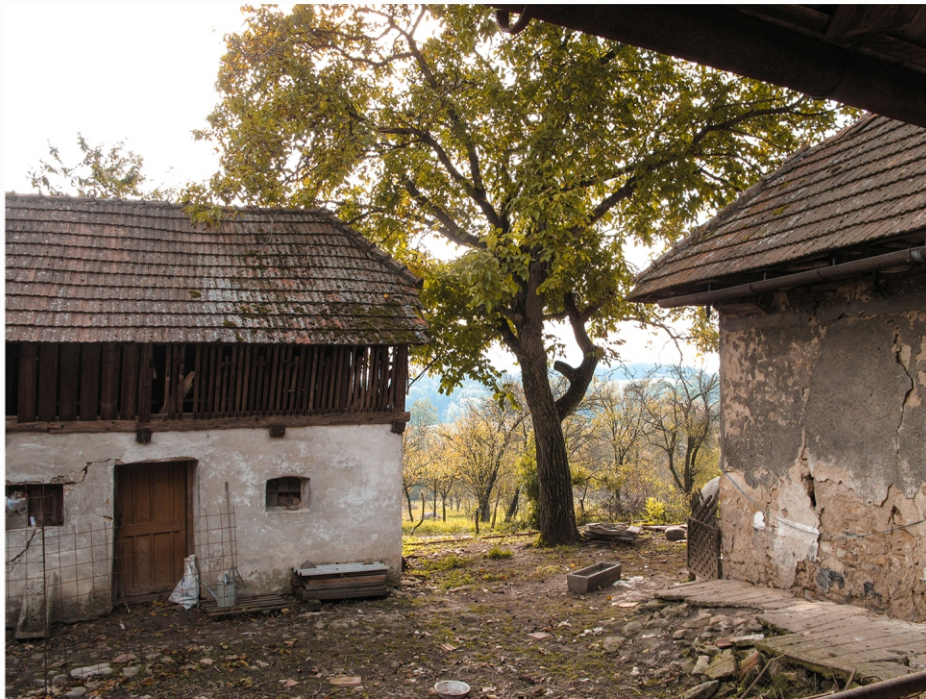
Ján Hromek - Z cyklu Jeseň na Kopaniciach