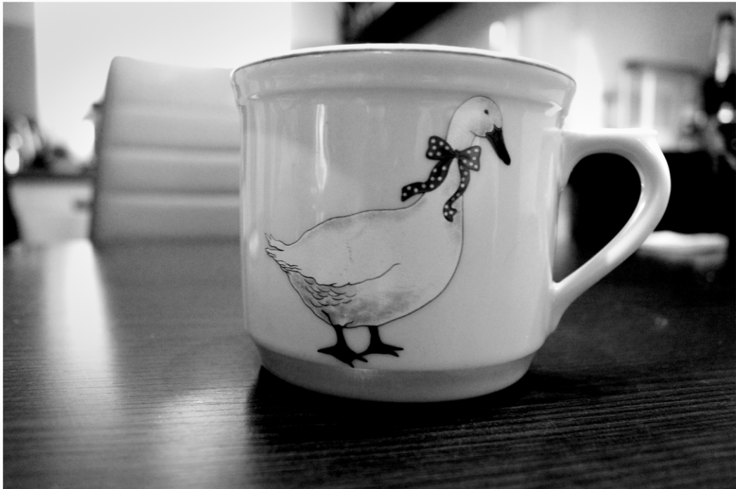
Filip Kalka - Klučka, Hrnček