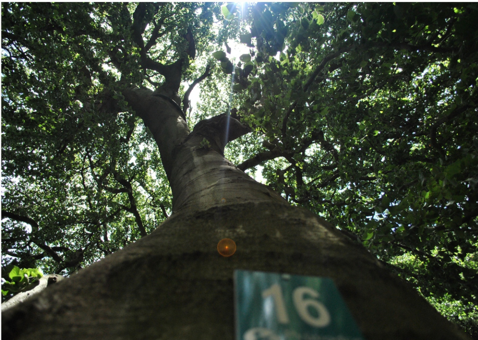
René Filip - Pohľad, "16"